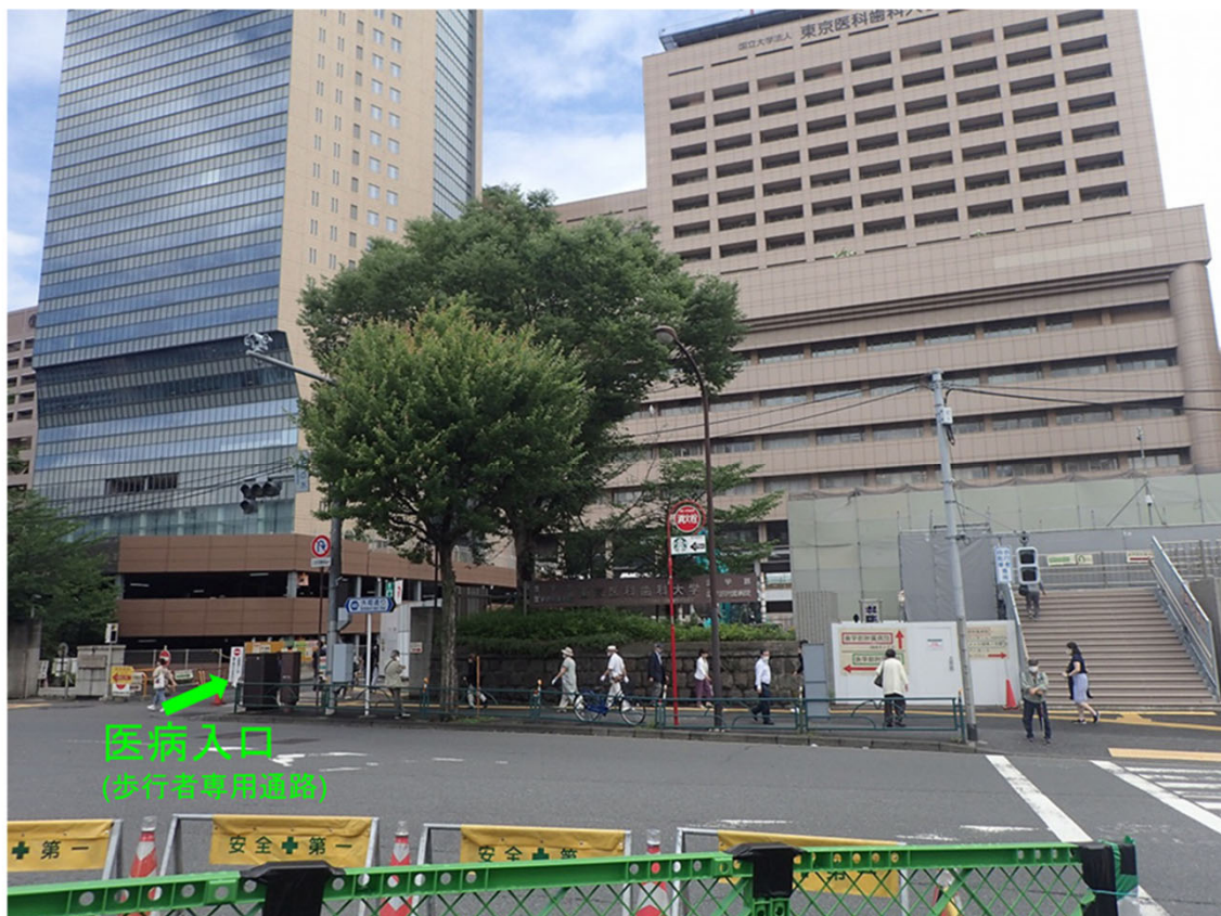
①歩行者用通路幅は2.4m