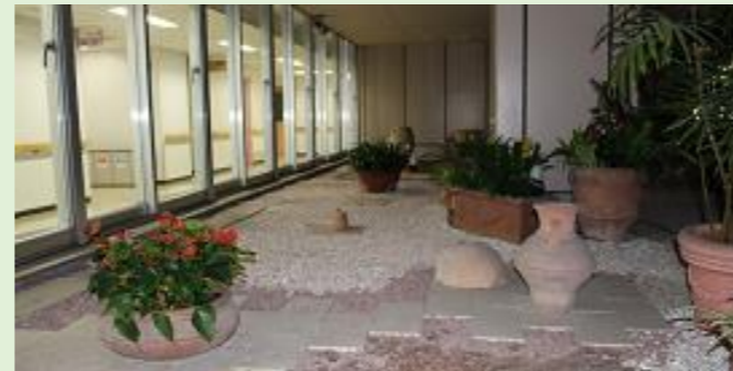
庭園 (立入はできません)