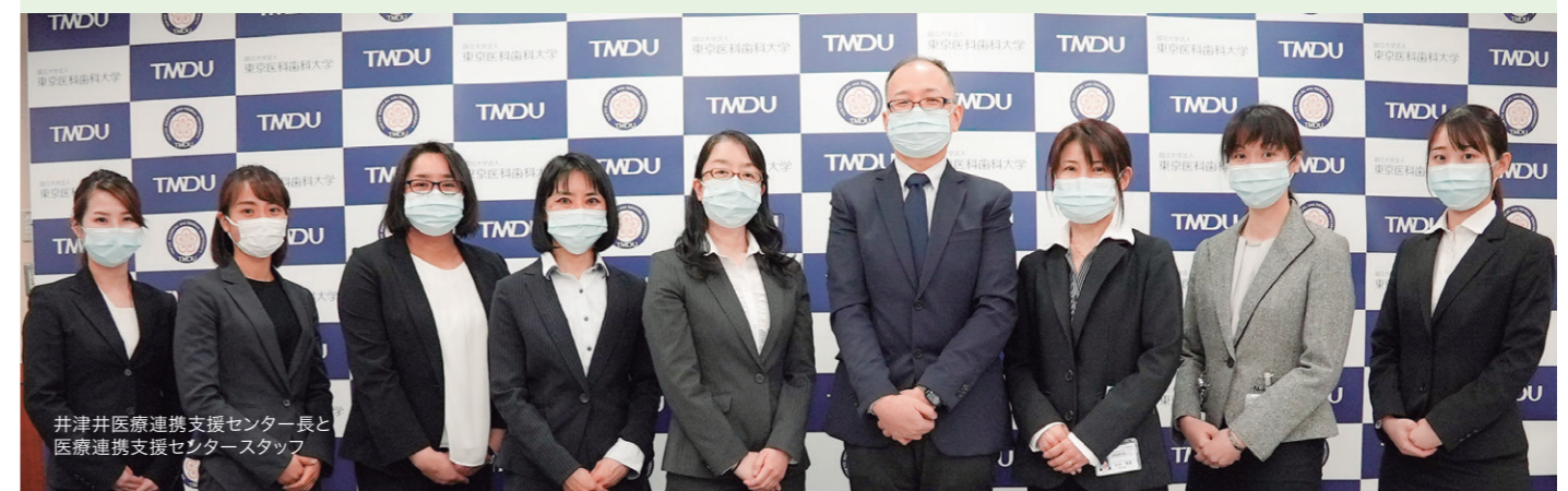
井津井医療連携支援センター長と 医療連携支援センタースタッフ