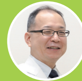
東京医科歯科大学病院 医療連携支援センター長 (病院長補佐)