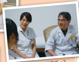
総合がん・緩和ケア外来ブース