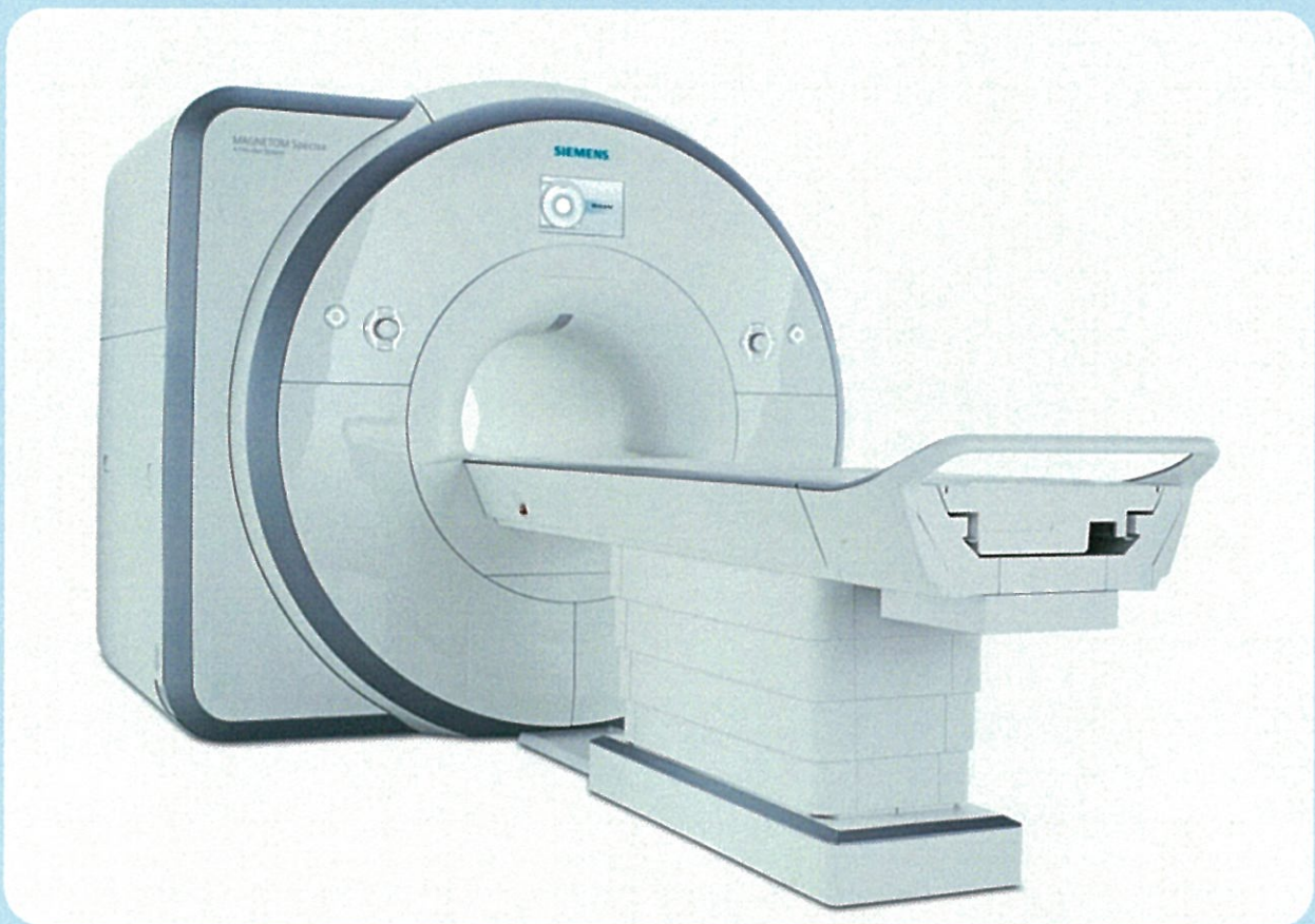
シーメンス社製 MAGNETOM Spectra

本学歯学部附属病院には、MRI装置（磁気共鳴診断装置）があり、口腔がんや骨髄炎、顎関節症など、頭頸部領域の疾患に対するMRIの画像診断を提供してきましたが、2013年4月に、より高い磁場強度（3テスラ）を持つ、最新鋭のMRI装置が導入されました。