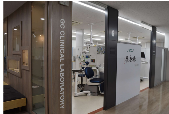
先端歯科診療センターに設置された GC CLINICAL LABORATORY